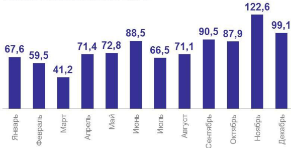
Динамика ввода жилья, тыс. м 2